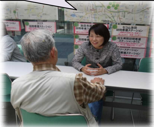
写真：めぐみ訪問看護ステーション 管理者