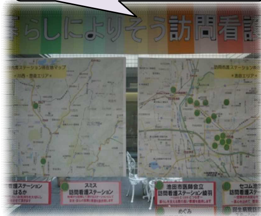
写真：訪問看護ステーションマップ