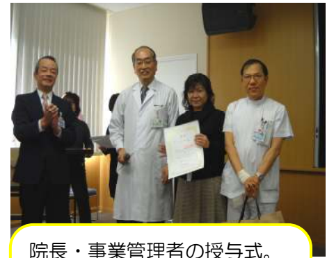
院長・事業管理者の授与式。ボラボラ隊はアイデア賞を受賞！（採点方式で順位決定）全12グループに賞がありました。