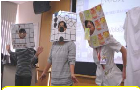
左から、将棋・囲碁・川柳のアピールです。期間を決めて患者さまに参加していただきました。