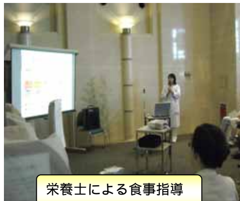
栄養士による食事指導