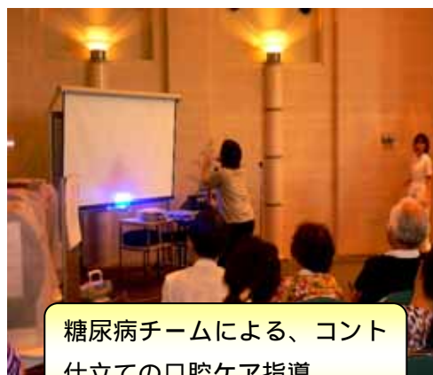
糖尿病チームによる、コント仕立ての口腔ケア指導