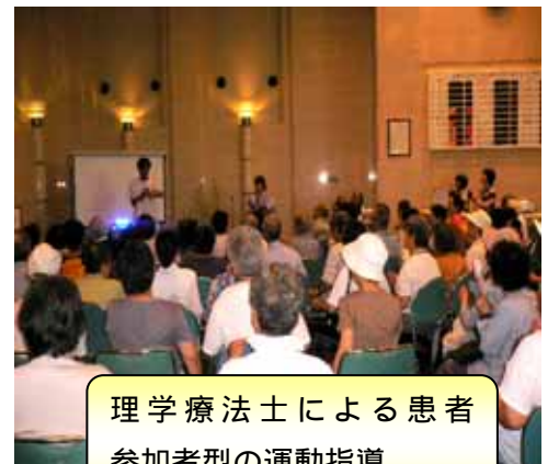
理学療法士による患者参加者型の運動指導