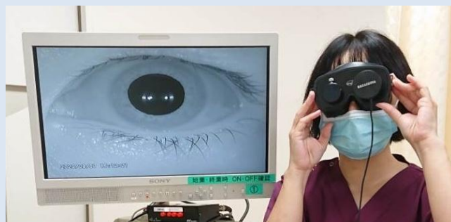
(ビデオフレンチェル眼鏡)

西日本でも大学病院を含む数施設しかない最新のめまいの検査(Video head impulse test、vHIT：前庭誘発電位検査、VEMP)をはじめ、関西でもトップレベルの検査体制が整っています。さらにCTやMRIの画像検査などを用いて脳に異常がないかも調べ、それらの結果を原因究明や治療方針に役立てています。